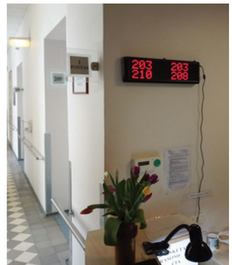
1 pav. Informacinis ekranas VŠĮ „Vilkpėdės ligoninėje“