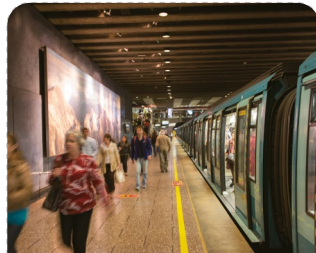
Traukinių, autobusų stotys