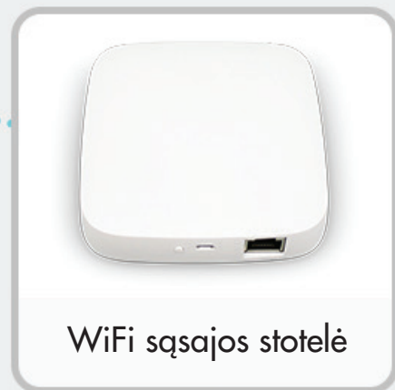
WiFi sąsajos stotelė