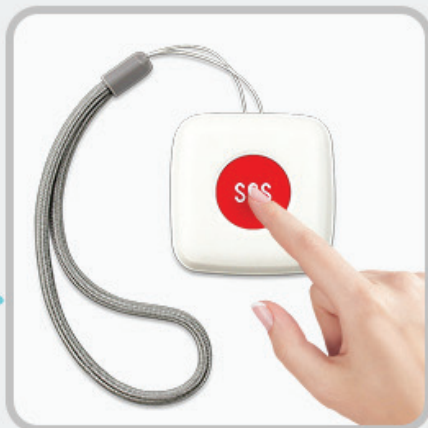
SOS mygtuko signalizacija